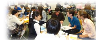
英語でのディスカッションの様子 (H26指定校) 渋谷教育学園渋谷高等学校