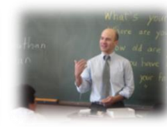
外国人講師による専門指導 (H26指定校) 大阪府立三国丘高等学校

グローバルな社会課題を発見・解決し、様々な国際舞台上で活躍できる人材(国際機関職員、社会起業家、グローバル企業の経営者、政治家、研究者等)の輩出