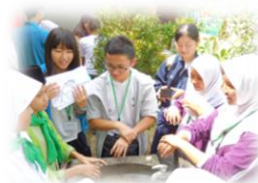
海外フィールドワークの様子 (H26指定校) 筑波大学附属板戸高等学校