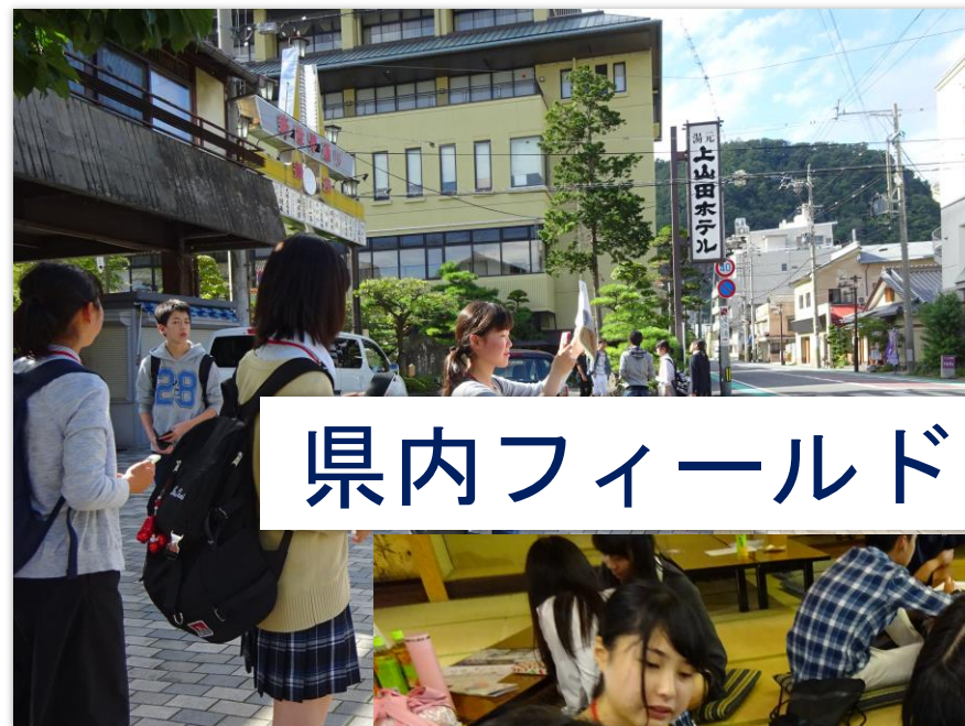
県内フィールドワーク