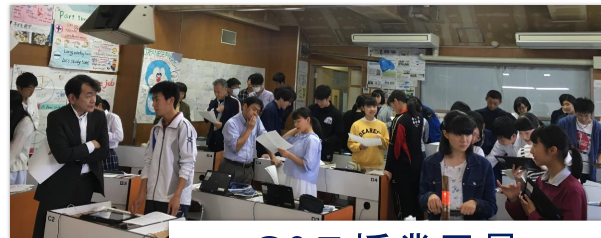
GS II 授業風景