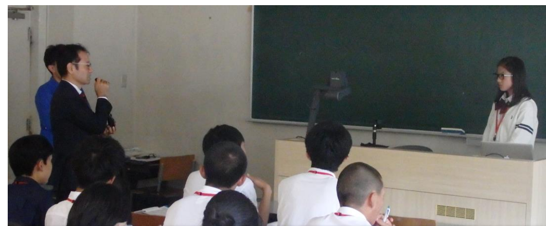
首都圏フィールドワーク